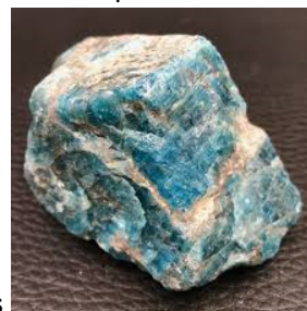
et/ou Apatites vertes

à l'entrée et à la sortie de la perturbation